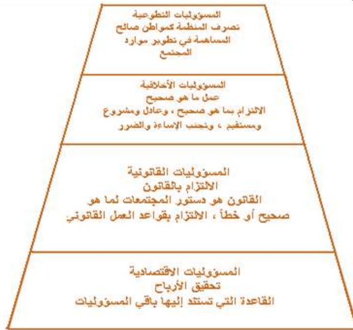
الشكل (2) هرم المسؤولية الاجتماعية

أصبحت المسؤولية الاجتماعية في الوقت الحاضر فلسفة تتبناها المنظمات في أنشطتها اليومية . وانطلاقاً من هذه الحقيقة ، يرى العديد من الباحثين أن على المنظمات الأخذ بنظر الاعتبار ليس فقط المسؤوليات الاقتصادية والقانونية بل المسؤوليات الأخلاقية والمبادرات التطوعية في مجال الاستجابة للتوقعات الاجتماعية الأخرى ، وقد استندت آراء هؤلاء الباحثين إلى نموذج (Carroll, 1979) الذي تضمن أربعة أنواع من المسؤوليات المتكاملة والتي يتوجب على منظمة الأعمال ممارستها حتى تستطيع النمو والبقاء (Carroll, 1991 : 42) ، وكما هو واضح في الشكل (2) .